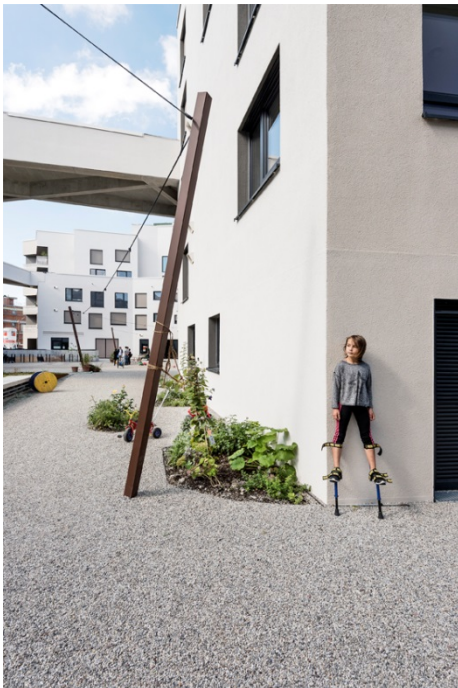
Wohnanlage wagnisART, München ARGE bogevischs buero mit SHAG Schindler Hable Architekten